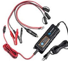
Automotive IP65 Lader