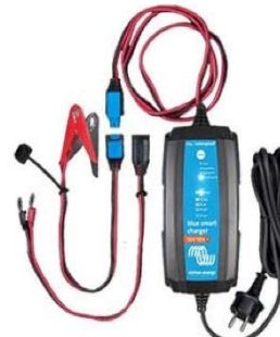
Blue Smart IP65